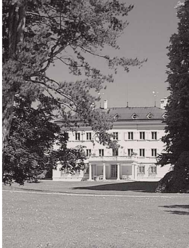
Evangelische Akademie Tutzing

© Konzept und Gestaltung: peilstöcker ■ design | Druck: Ulenspiegel Druck & Verlag GmbH, Andechs | Tel. 0 81 53-990 350